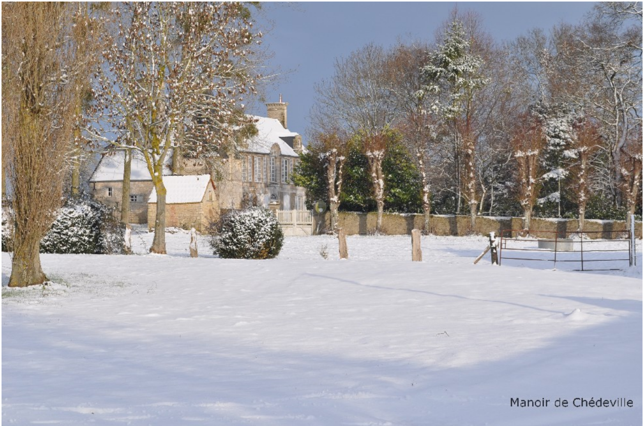
Manoir de Chédeville