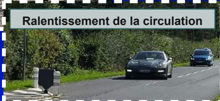
Ralentissement de la circulation