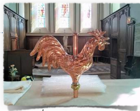
le nouveau coq (installation courant novembre)

D'autres actions ont été réalisées dans le courant de l'été par les membres de l'association tels que le traitement du bois de l'autel de la chapelle du Saint Sacrement ou le nettoyage des statues. Par ailleurs, en lien avec la commune, le coq du clocher, qui ne joue plus son rôle de girouette depuis de nombreuses années, sera remplacé en profitant d'une intervention sur le paratonnerre et la toiture de l'église. Sur le plan des activités, le traditionnel marché de Noël aura lieu les 10 et 11 décembre 2016.