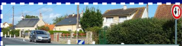
Création de place de stationnement