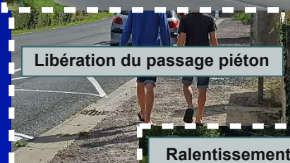
Libération du passage piéton